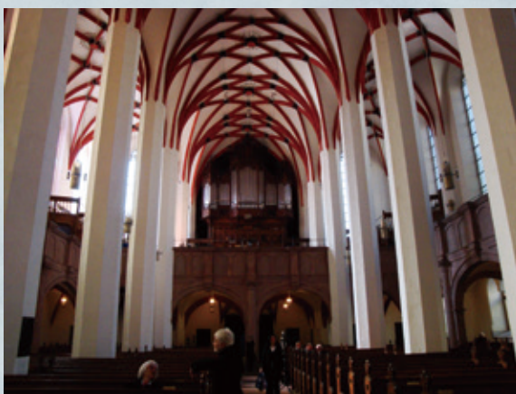
ライプチヒ トーマス教会