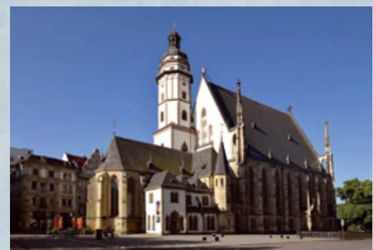
ライプチヒ聖トーマス教会