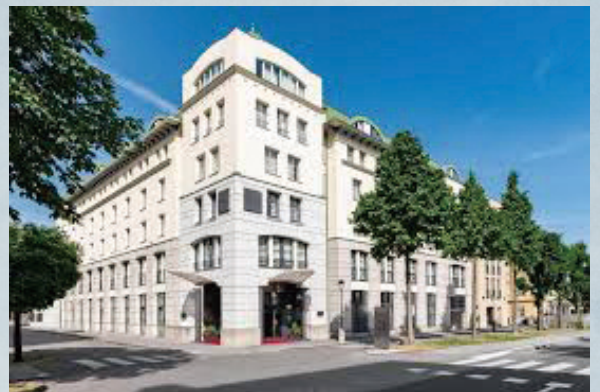
ザルツブルクホテル