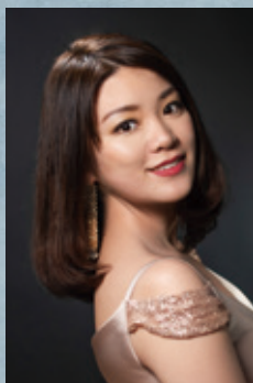
ソプラノ:森野美咲(ザルツブルク公演に参加)

大阪・高槻市出身。大阪音楽大学在学中より、高槻市音楽団などで指揮活動を展開し、1990年から7年間に亘ってウィーンへ留学。98年にキリル・コンドラシン国際指揮者コンクールでベスト8に選ばれ、翌99年、ウィーン楽友協会ホールでのトーンクンストラ交響楽団との演奏会において、ベートーヴェン交響曲第9番を指揮してウィーンデビューを果たした。2000年に小澤征爾音楽塾オペラプロジェクトI、さらにII、III、で、アシスタント及び合唱指揮を務める。06年には、ウィーンとプラハでモーツァルト生誕250年「レクイエム・ガラ」特別演奏会でタクトを振り、絶賛を博した。09年、11年、15年、ベルリン、プラハ、ローマの「国境なき合唱団&ベルリン・シンフォニエッタ」チャリティー公演等で、ベートーヴェン「第九」を指揮、2024年にはあさま管弦楽団、フロイデ・コア・ヨコハマを率いてウィーン楽友協会、ザンクトフローリアン修道院での演奏旅行も大成功に収めた。ダイナミックさと繊細さを併せ持つ横島の指揮は、聴く者を、音楽そのものが持つ深い感動へと導く。温厚な人柄と情熱的かつ的確な指示によって、奏者の力量を引き出し、やがて聴衆と渾然一体化するその音楽は、多くの奏者・聴衆から熱い支持を得ている。