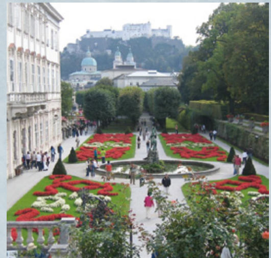
ザルツブルク ミラベル公園