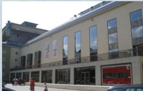
モーツァルトハウス