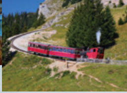
シャープベルク鉄道