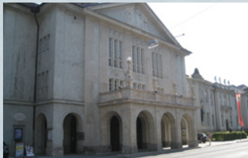
モーツァルテウム大ホール