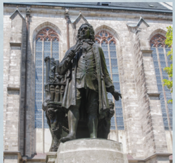
ライプチヒ バッハ像